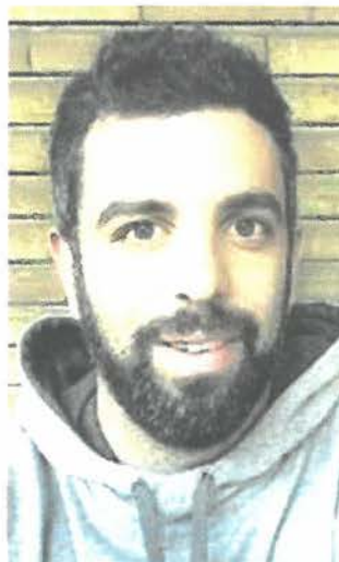
REGISTA Giovanni Boscolo

La storia racconta di Marisa, che da quando è andata in pensione vede la sua vita profondamente cambiata e si sente inutile, abbandonata, senza scopo. Il mondo sembra andare ad un'altra velocità dove non c'è tempo per lei, nemmeno per una semplice telefonata o per una visita. L'incontro con un'organizzazione segreta di pensionati le svelerà uno dei più grandi misteri della storia dell'umanità: il traffico stradale. La protagonista ritroverà così un nuovo modo per dimostrare a tutti che esiste: rallentare gli altri. Un pretesto che vuole gettare una luce su una ca-