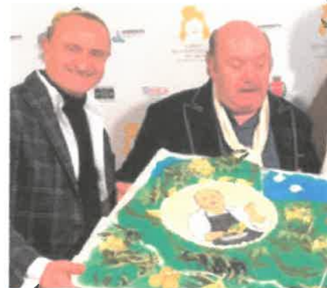
Lino Banfi riceve la torta da Antonio Cafiero

Questa edizione ha inoltre consolidato il rapporto con il Comune di Sorrento e la Film Commission Regione Campania anche grazie ad una serie di iniziative speciali relative alla produzione audiovisiva nel territorio. Nell'ambito del progetto "Nuove strategie per il cinema in Campania", la Film Commission in collaborazione con gli "Incontri" e Maia associazione culturale, ha promosso l'iniziativa di networking professionale denominata "Incontri di co-produzione", che ha presentato 15 progetti audiovisivi con potenziale di co-produzione, all'attenzione dei produttori tedeschi.