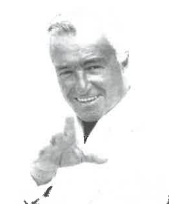
Vittorio De Sica