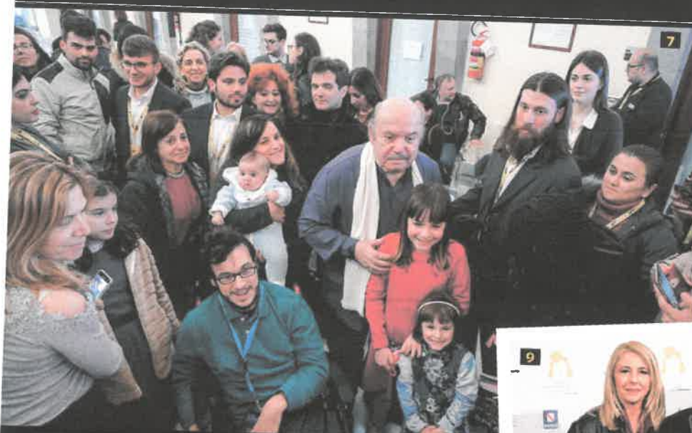
6. La regista, scrittrice e produttrice tedesca Doris Dörrie, ospite d'onore di questa edizione degli Incontri Internazionali del Cinema di Sorrento 7. Lino Banfi, circondato da fan grandi e piccoli, non si sottrae a fotografie e autografi. 8. Christian De Sica con la moglie Silvia Verdone durante la serata dedicata al Premio De Sica. 9. Lino Banfi con la nostra Alessandra De Luca, protagonisti di uno degli appuntamenti di Ciak Incontra. 10. Lino Banfi durante l'incontro con il pubblico ha ripercorso la propria carriera e presentato il film Indovina chi sposa mia figlia? , dove ha recitato in tedesco.