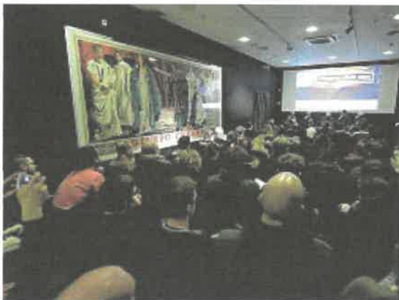
Sala Deluxe Gran pianone per gli incontri e le masterclass in programma